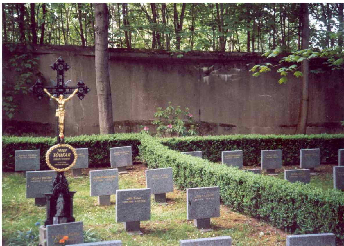
Hřbitov v Dáblicích, čestné pohřebiště, kde je v šachtě č. 21 uložen Josef Toufar (stav květen 2011)